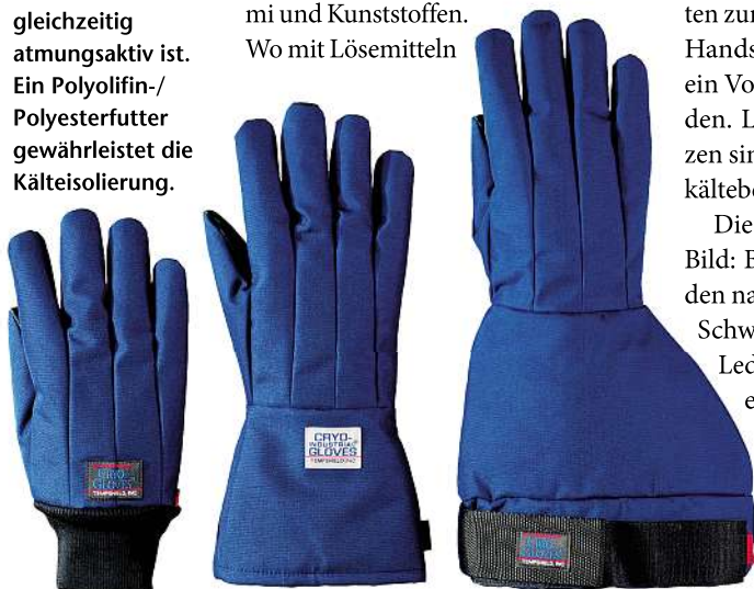
Bild 1: Als Außenmaterial der Schutzhandschuhe für Arbeiten mit tiefkaltem Stickstoff dient halbdurchlässiges Nylon, das zu 100% wasserabweisend und gleichzeitig atmungsaktiv ist. Ein Polyolifin-/Polyesterfutter gewährleistet die Kälteisolierung.

Holger B. Fritzsche ist Inhaber der Laboplus in 80999 München, Tel. (089) 8125424, info@laboplus.de